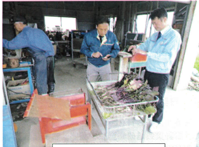
「ひげ根とり機」開発風景