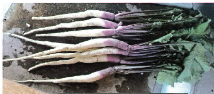
「ひげ根とり」をした日野菜

2月10日以降については、「受注生産(特注品)」となるため、価格は、かなり高くなります。ぜひご検討ください。